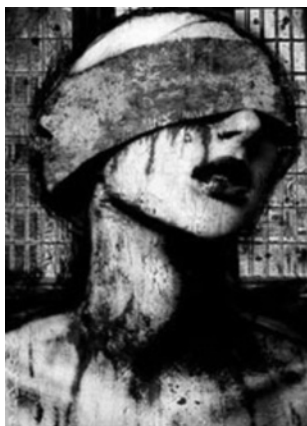
REPRESSIONE IN BIELORUSSIA

La Bielorussia è una delle repubbliche in cui si è divisa l'ex URSS; è un paese poverissimo: il rublo viene considerato una moneta forte e l'aspirazione di molti giovani è l'emigrazione a Mosca. Il governo di Lukashenko esercita il potere in maniera autoritaria; l'opposizione esiste solo formalmente, non è per nulla incisiva e non ha nessuna voglia di mettere in discussione il padrone della Bielorussia. Dal 1998 la federazione anarchica bielorusa edita il giornale "Navinki". I compagni hanno scelto di non fare un giornale nello stile classico delle pubblicazioni anarchiche, ma di editare un giornale satirico. Il giornale è satirico fin dal titolo: "Navini" (Notizie) è il nome del giornale dell'opposizione, "Navinki" (Notizioline) oltre ad esserne il vezzeggiativo è anche il nome di un manicomio alla periferia di Minsk. Visto che il giornale è l'unico in Bielorussia che attacca sia il governo che l'opposizione, ha riscosso, fin da subito, un notevole successo. La sua natura di giornale satirico gli ha dato inoltre la possibilità di diventare punto di riferimento per moltissimi artisti della Bielorussia. Tra gli artisti coinvolti, oltre a disegnatori e fumettisti, ci sono anche attori e musicisti che hanno realizzato, nel 2001, "Slucij s pazanom" (in italiano suonerebbe come "Storie coatte") il primo